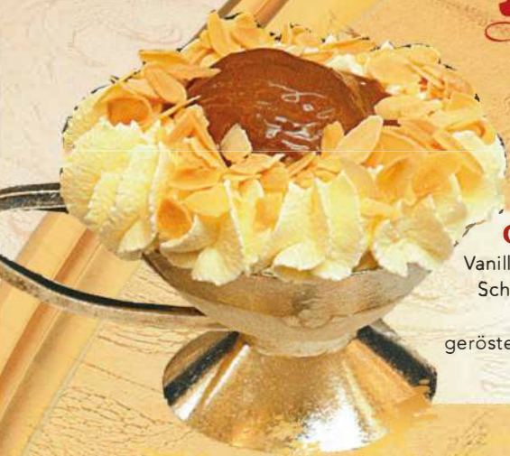
COUP HELENE Vanilleeis, Kompottbirne, Schokoladeobersauce, Schlagobers, geröstete Mandeln CFGH 4.80 €